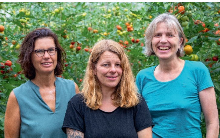
Das Team der Biolandgärtnerei rhizom freut sich auf Sie!

Neben dem gärtnerischen Arbeiten ist uns die Arbeitsatmosphäre sehr wichtig. Kollegialität und das gemeinsame Lernen sind die Voraussetzungen für eine erfolgreiche Qualifizierung.